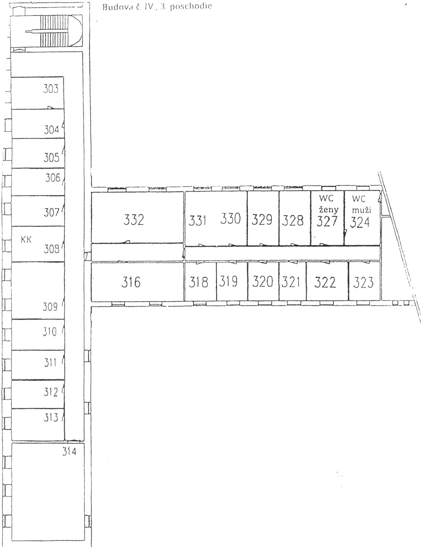
Budova č. IV., 3. poschodie