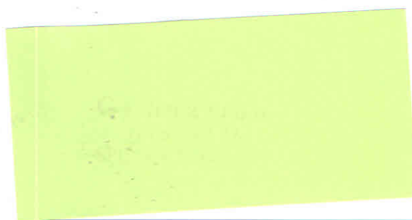
Pečiatka a podpis riaditeľa cvičnej školy