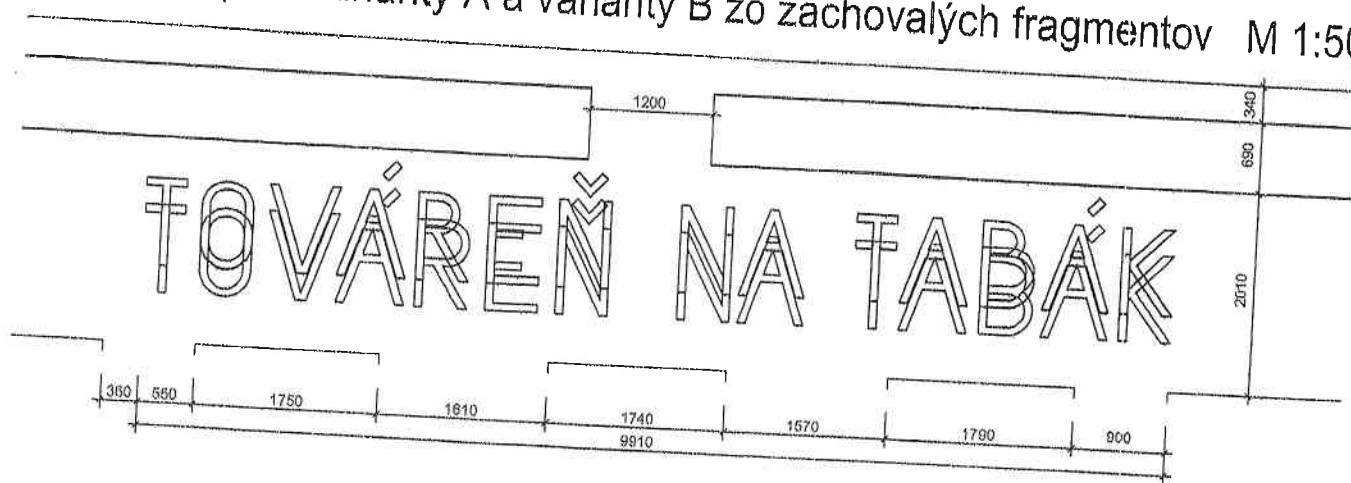
Varianta A M 1:50

Obnova nápisu varianty A a varianty B zo zachovalých fragmentov M 1:50