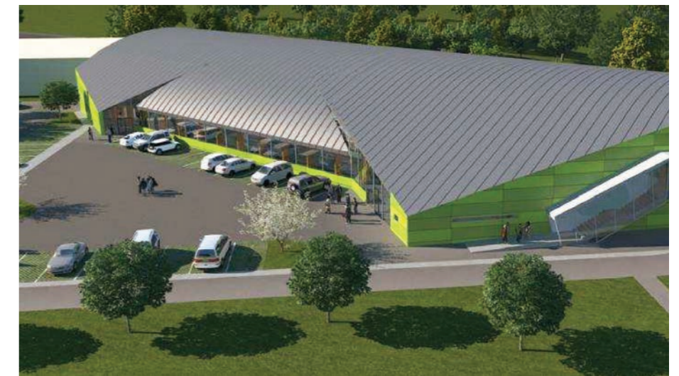
roku župa vybudovať v areáli Gymnázia Pavla Horova v Michalovciach.