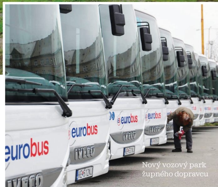
Nový vozový park župného dopravcu

chaloviec do Sobraniec, stavebné práce ešte prebiehajú na ceste II/547 od mosta Ružín v smere na Spišské Vlachy či na ceste II/555 vedúcej z Michaloviec do Kráľovského Chlmca. Peniaze z Integrovaného regionálneho operačného programu čerpali aj župné stredné školy. Išlo predovšetkým o projekty, ktoré zvýšia kvalitu odborného vzdelávania na stredných školách a prepájajú vyučovanie s praxou. Čo je dôležité, peniaze z Bruselu pomáhajú znižovať regionálne rozdiely a zlepšovať kvalitu života obyvateľov aj v menších obciach a mestách na východe Slovenska.