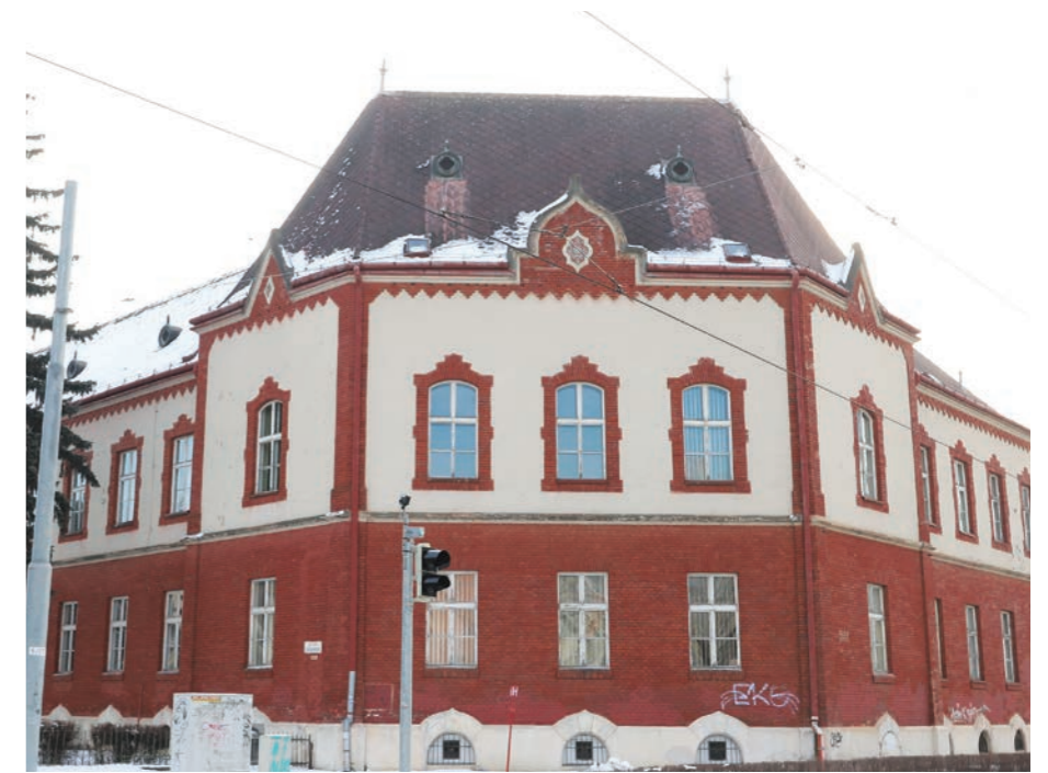
zium Javorová v Spišskej Novej Vsi. Nový športový areál chce v tomto