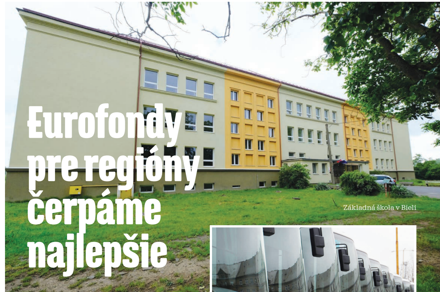
Základná škola v Bieli