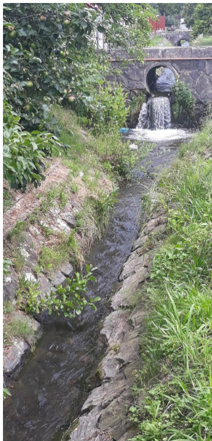
Vodozadržné opatrenie - spevnenie brehov potoka navezenými veľkými balvanmi