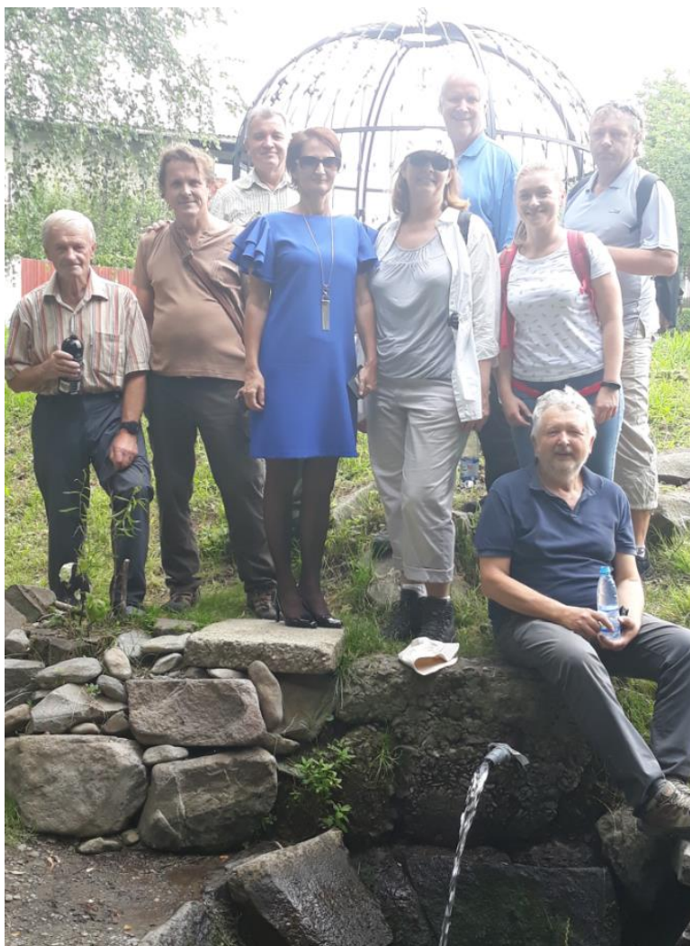
Účastníci stretnutia členov vodnej rady v obci Jovsa