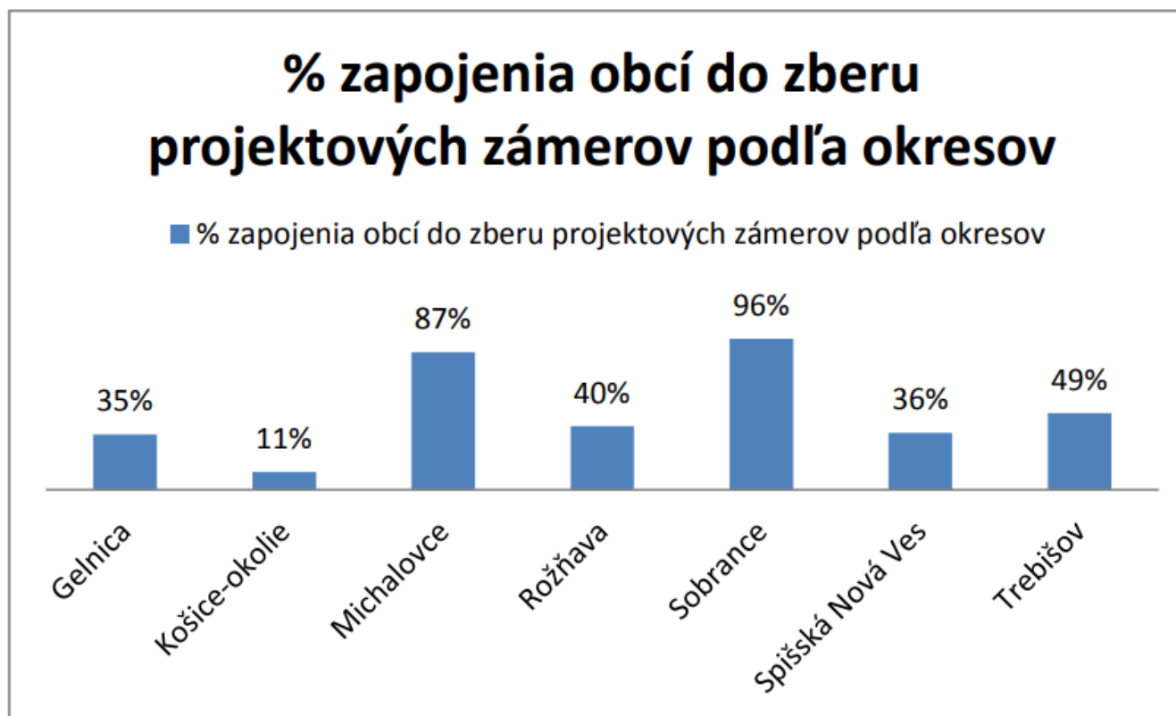
Graf 2 % zapojenia obcí do zberu projektových zámerov podľa okresov