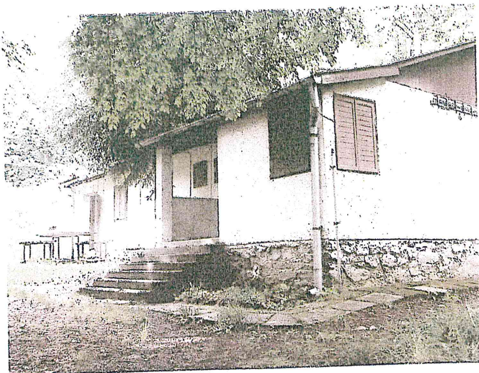
CHata súp.č. 170 na parc.č.244 pozemky p.č. 243/1, 243/3 a 243/4 obec Malá Lodina , kat.územie Ružín