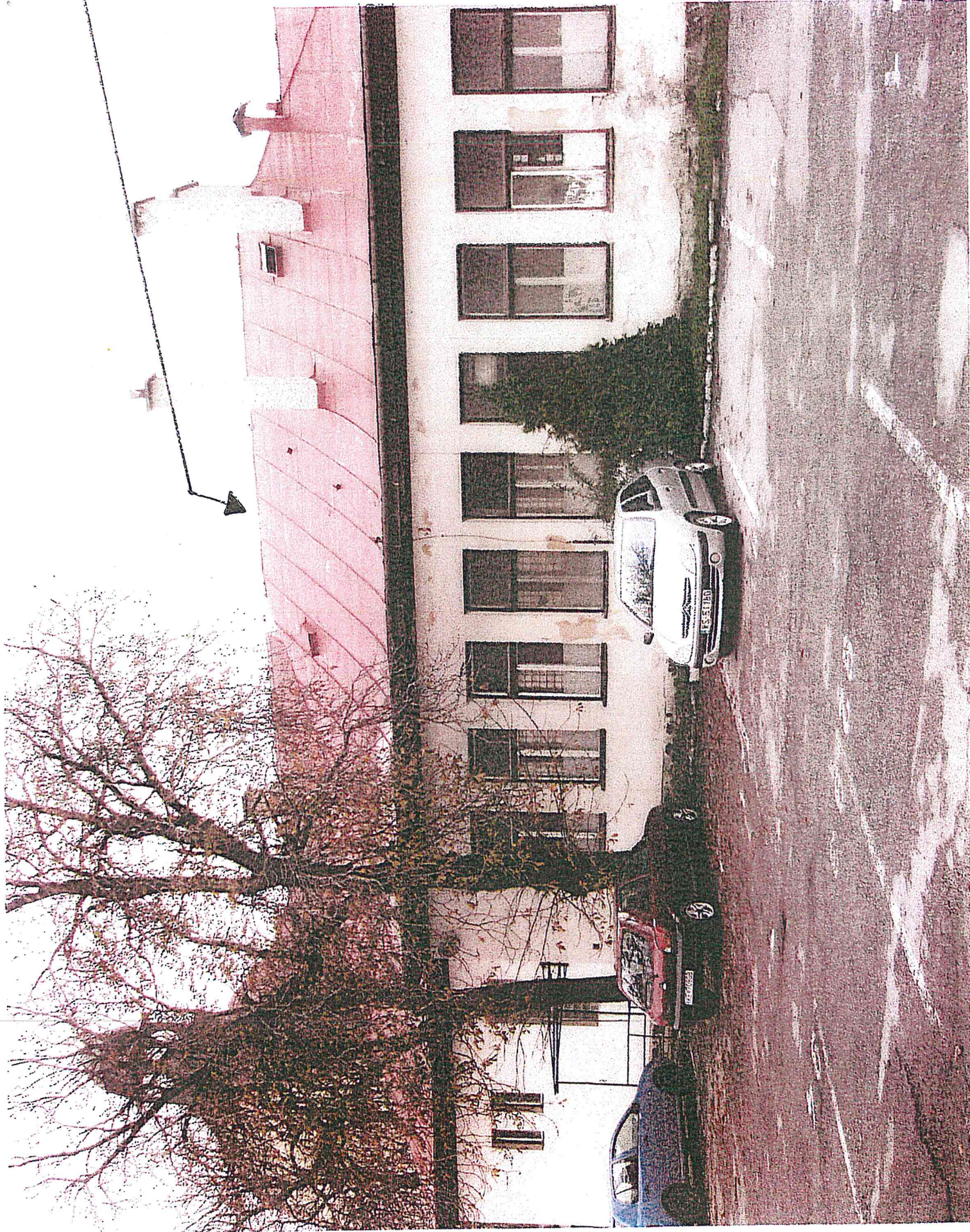
Ceňok č. 2 (jedáček a sklad s.č. 3027; sklad s.č. 3028)