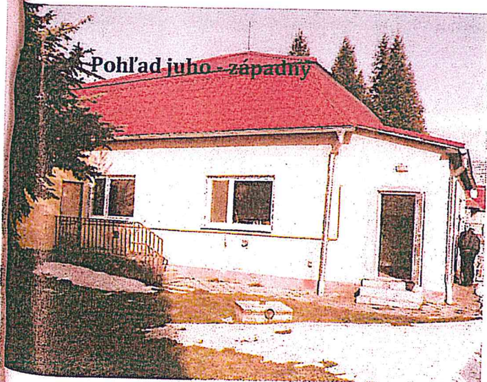
Pohľad juho - západný