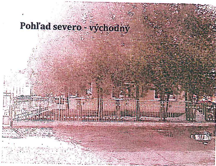
Pohľad severo - východný