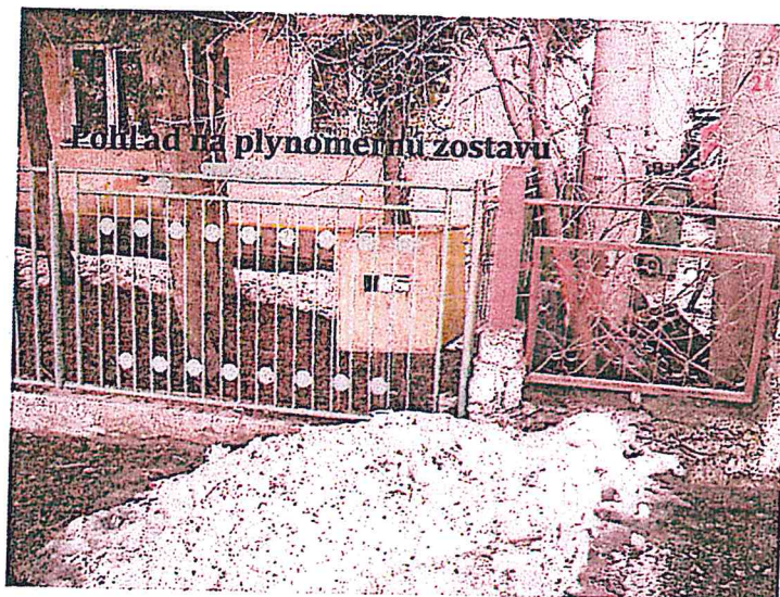
Pohľad na plynovú zostavu