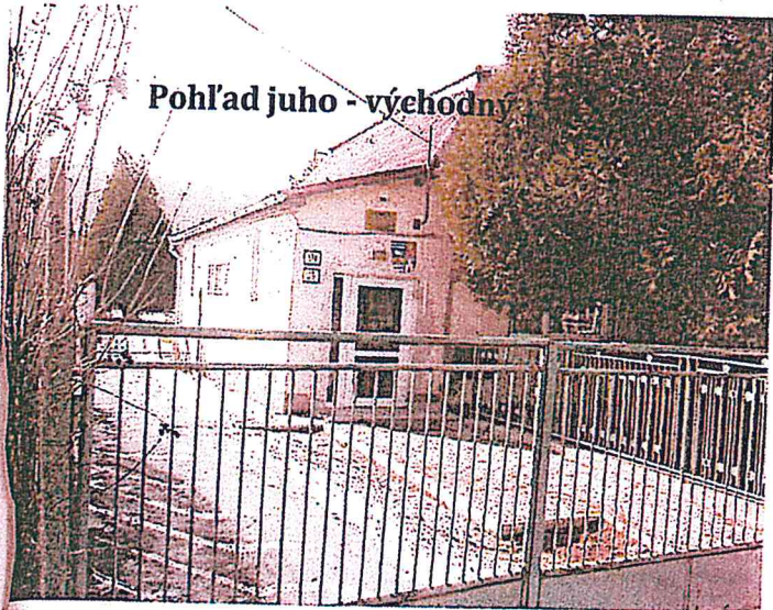
Pohľad juho - východný