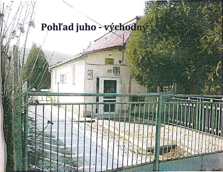
Pohľad juho - východný