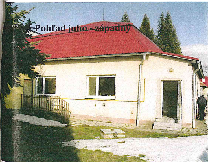
Pohľad juho - západný