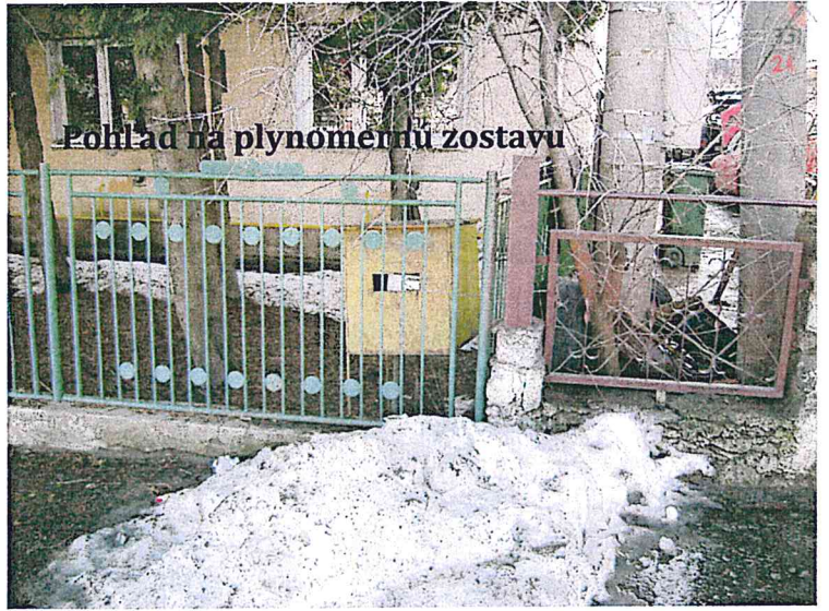
Pohľad na plynovú zostavu