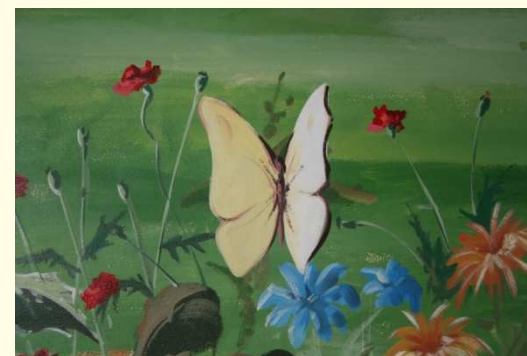
Pohľad do rehabilitačnej dielne

Poslaním Integry v Michalovciach je podpora ľudí s duševnými chorobami dôstojne žiť a nachádzať možnosti sebarealizácie v spoločnosti.