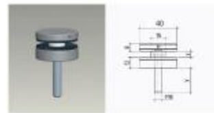
Fixný bodový úchyt skla – Fi 40 mm

Pamätnú tabuľu osadiť z vonkajšej strany na priečelie objektu SO 01 (schválené zást.KPÚ), ktorá bude situovaná pri vstupe do priestoru galérie vedľa vstupných dverí - odsadenie od ostenia dverí min.100mm (tabuľu pri hlavnom vstupe do objektu SO 02 nie je možné osadiť, a to z dôvodu nepostačujúcej plochy a priestoru pre montáž). Tabuľa bude pozostávať z čierneho kaleného/bezpečnostného skla hr.16mm s gravírovaným textom podľa predlohy ROP. Tabuľu pripevniť v rohoch pomocou fixných bodových úchytoch skla priemeru 40mm (napr. od spol. Clascomp-Fi40mm) a závitovej tyče priemeru 8,0mm cez zateplenie ETICS hr.cca.80mm. Kotviť do tehlového muriva s presahom min.50mm. Všetky kovové prvky a príslušenstvá musia pozostávať z ušľachtilej/nerezovej ocele. Architektonický návrh nenahrádza výrobnú a dielenskú dokumentáciu. Material Antikor (V2A) Fixný bodový úchyt skla – Fi 40 mm