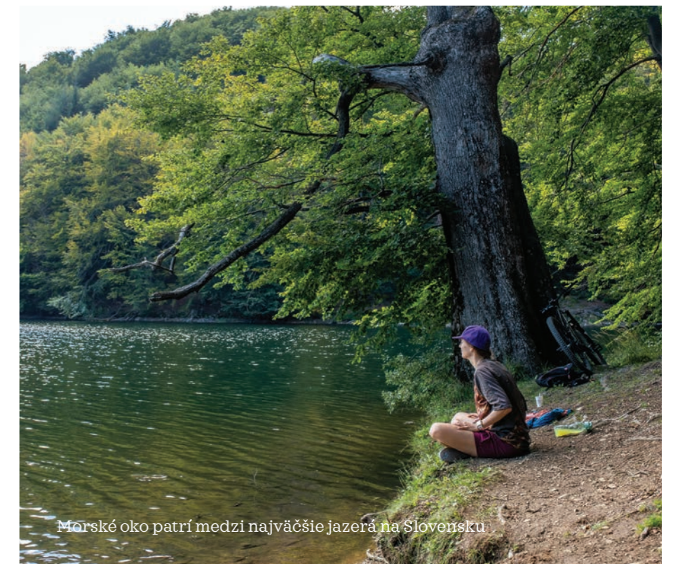
Morské oko patrí medzi najväčšie jazerá na Slovensku

ktorý obyvateľ lesa vydáva, a pritom aj zľahka vystrašili naivných turistov. Kiežby aj na iných, podobne krásnych miestach prírody boli hlasy zvierat tým jediným, čo by sa z reproduktorov ozývalo.