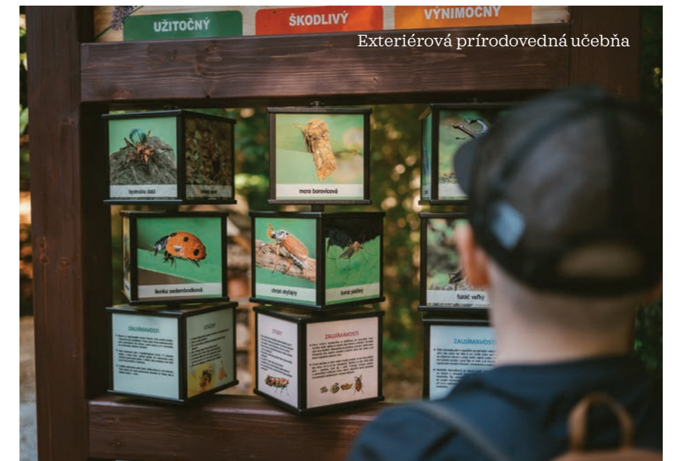
Exteriérová prírodovedná učebňa

Po zostupe zo Sninských kameňov sme pred odchodom domov cítili potrebu popásť sa ešte pohľadom z brehu jazera. Tentoraz sme si vybrali pláž pred bufetom Morské oko, ktorý bol síce zatvorený, ale na jeho lavičkách pri vode sa sedelo dobre. Po nejakom čase nás trochu začalo znepokojovať niečo, čo znelo ako rev medveďa. Po chvíli bolo napätie a záhadám koniec. Zdroj zvukov pochádzal z infor-